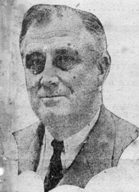
F. D. ROOSEVELT